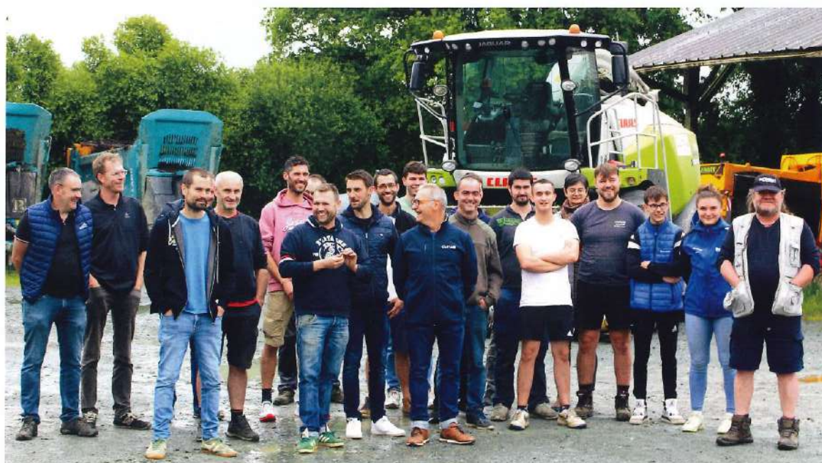
L'ensemble de l'équipe des salariés et des administrateurs présents mi-juin 2024 à la cuma du Bocage nantais.

** Voir article "Mode d'emploi pour une journée d'accueil en cuma", page 30.